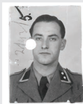
Alois Bohnert (1914-), dowódca Sonderkommando Referatu IV-S Gestapo, uczestnik akcji pacyfikacyjnej w Sułkowicach